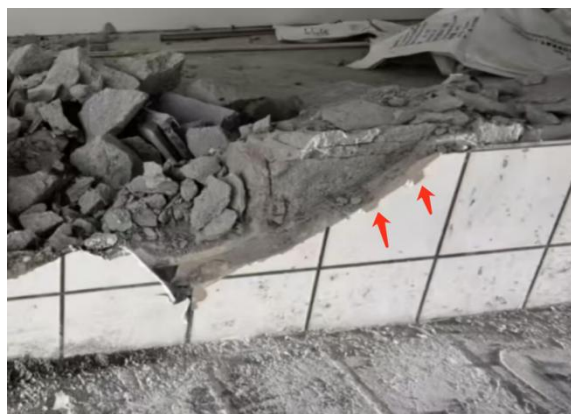
图 3-4 墙体断口处砸击痕迹