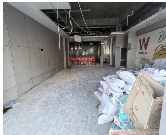
图 3-2 事故现场全景