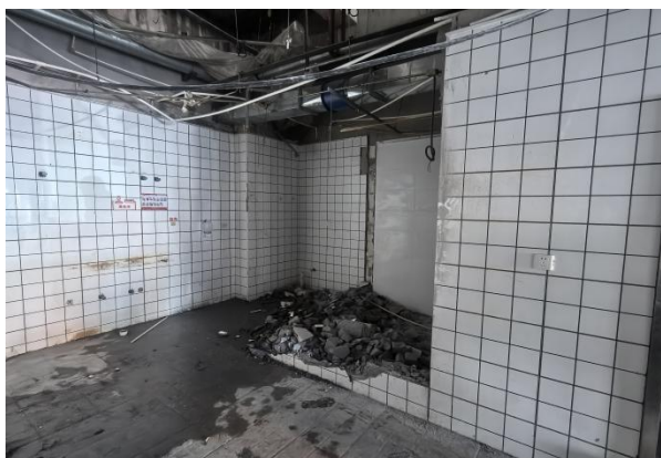
图 3-3 墙体坍塌情况图