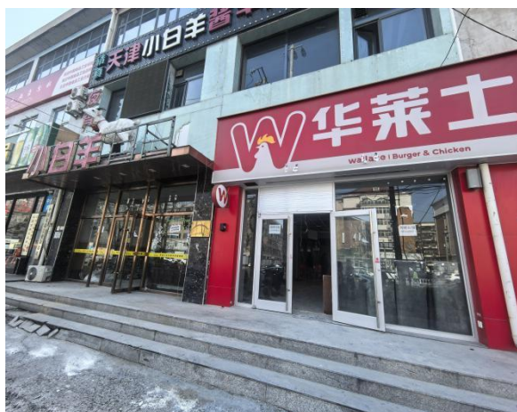
图 3-1 底商全景